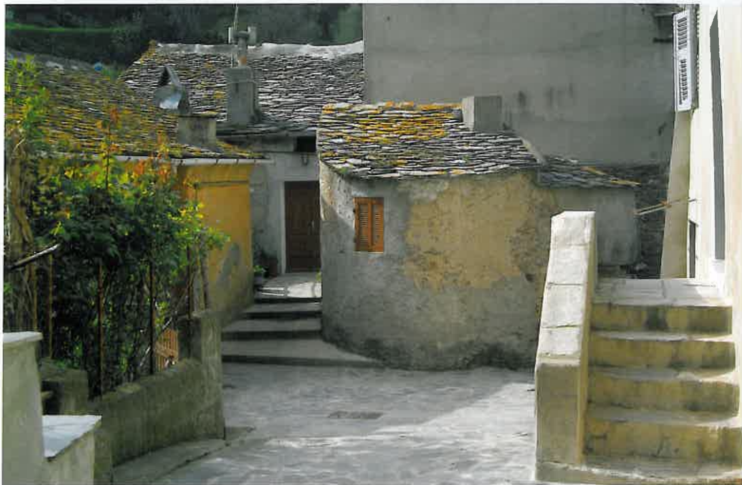
Vescovato s'accroche à un promontoire. Les ruelles pentues et les marches de pierre attestent sans cesse de cette réalité géographique.

S ur un promontoire, entouré d'un ruisseau qui pourrait être une douve de fortune, Vescovato s'élève comme une forteresse médiévale dont les remparts seraient les murs gris de ces hautes maisons aux toits de lauzes. Impressionnant de beauté et de sobriété, le village semble s'ériger en colimaçon pour mieux s'enrouler autour du relief jusqu'à parvenir à sa cime, que couronne la belle église baroque vouée à San Martinu. Un jardin exotique rompt quelque peu avec le caractère si corse de la Casinca, mais donne une personnalité unique à Vescovato. « Vescovato », l'évêché en italien. Le choix du nom de cette belle commune viendrait en effet de l'évêque de Mariana, Opizo Pernice, qui, vers 1269, avait établi une résidence à Cortecato, le promontoire se lequel se trouve la chapelle romane de San Michele. Il aurait découvert, lors d'une partie de chasse aux oiseaux, cette colline et sa source fraîche. Le lieu lui parut si beau qu'il y fit transférer sa résidence, le siège de l'évêché. Il l'appela Vescovato.