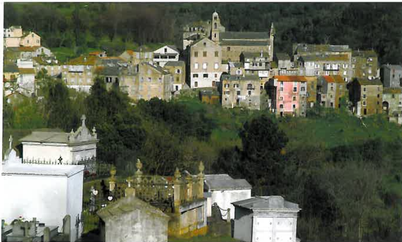
Vu du cimetière, Vescovato présente une accumulation de maisons placées sous la protection de la grande église San Martinu.